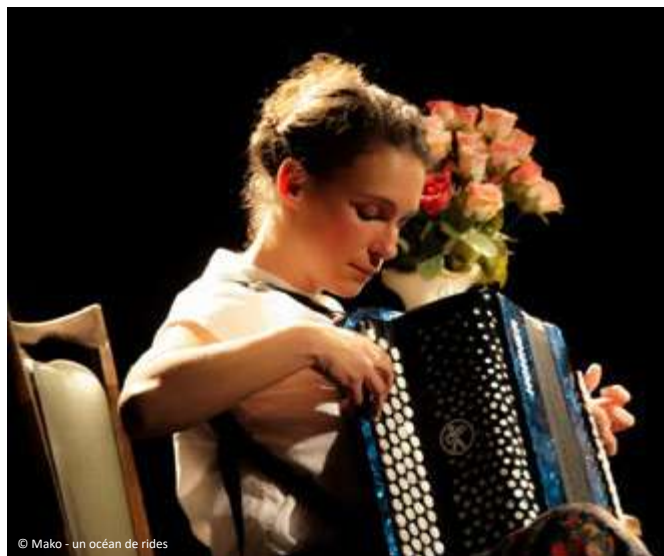
© Mako - un océan de rides

Médiathèque intercommunale Aimé Césaire à Villiers-le-Bel*