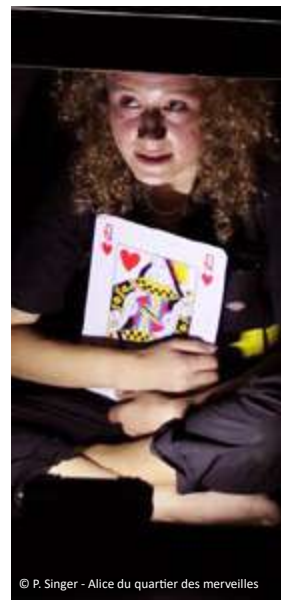
© P. Singer - Alice du quartier des merveilles