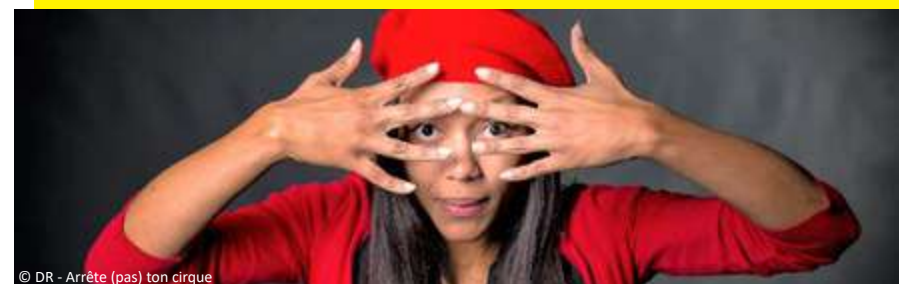
Arrête (pas) ton cirque