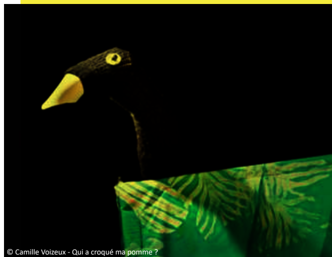
© Camille Voizeux - Qui a croqué ma pomme ?

Dans le cadre du festival Premières Rencontres, organisé par la compagnie ACTA, en partenariat avec Roissy Pays de France.